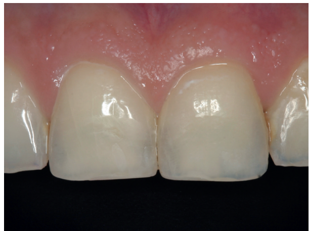
Abb. 12: Reparatur mit Komposit