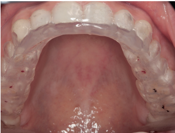
Abb. 9: Michigan-Schiene

Bei Schlafbruxismus kann die Behandlung durch Methoden des Biofeedbacks (z. B. Stimulation der Kaumuskelatur (Abb. 10) oder Vibrationsfeedback mittels einer Schiene) unterstützt werden.