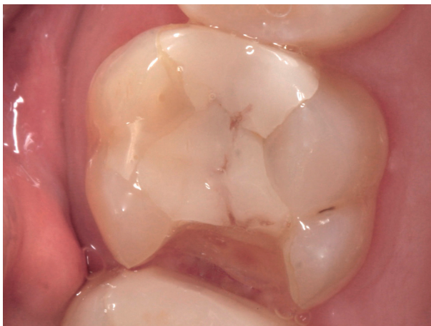
Abb. 7: Bruch einer Kompositfüllung

Auch wiederholt auftretende Schäden an Restaurationen, wie Absplitterungen an der Keramik oder Brüche von Prothesen oder Implantatversorgungen, können auf erhöhte Bruxismusaktivität hinweisen (Abb. 7, 8).