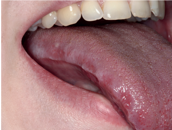
Abb. 5: Zahnabdrücke am Zungenrand

Presst man mit den Zähnen finden sich oft Zahnabdrücke am Zungenrand (Abb. 5) und weiße Linien in Höhe der Zahnreihen auf der Wangenschleimhaut (Abb. 6).