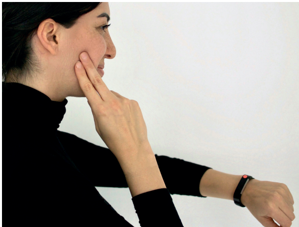
Abb. 15: Rote Punkte zur „Selbstbeobachtung“

Bei Wachbruxismus kann die Selbstbeobachtung helfen. Normalerweise sollten Sie bei geschlossenem Mund keinen Zahnkontakt haben. Kleben Sie einen farbigen Aufkleber (im Bürobedarf) auf Gegenstände in ihrer Umgebung. Dazu eignet sich zum Beispiel die Armbanduhr (Abb. 15), der Monitor Ihres Computers, das Handy oder der Autorückspiegel. Immer wenn Sie den Punkt sehen, kontrollieren Sie die Stellung der Zähne zueinander. Sollten Sie sich ertappen, die Zähne zusammenzuhalten, öffnen Sie den Mund weit und schließen Sie ihn entspannt, ohne dass sich die Zähne berühren. Halten Sie die Lippen geschlossen, die Zähne auseinander!