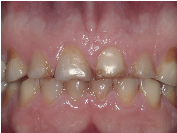
Abb. 13: Fortgeschrittener Zahnverschleiß

Schäden an den Zähnen können, je nach Art und Umfang, mit keramikverstärkten Kunststoffen (Komposit, Abb. 11, 12) oder mit Teilkronen oder Kronen wiederhergestellt werden (Abb. 13, 14).