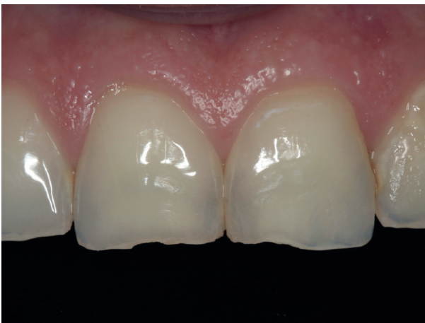
Abb. 11: Absplitterungen am Zahnschmelz

Die Physiotherapie leistet im Rahmen der Funktionstherapie einen wichtigen Beitrag zur Entspannung der Kaumuskelatur und der Verbesserung der Beweglichkeit der Kiefergelenke. Insbesondere bei Wachbruxismus können Übungen zur Achtsamkeit und Selbsthilfe vermittelt und trainiert werden.